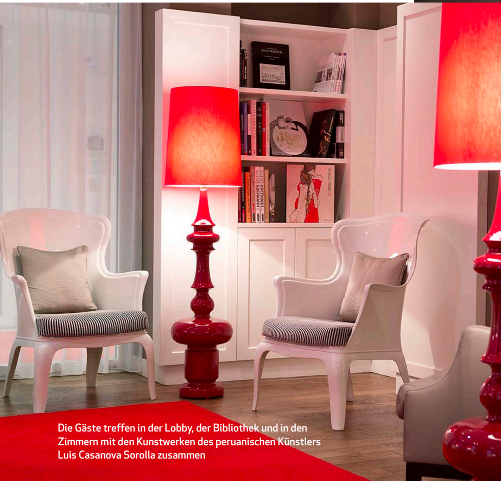
Die Gäste treffen in der Lobby, der Bibliothek und in den Zimmern mit den Kunstwerken des peruanischen Künstlers Luis Casanova Sorolla zusammen