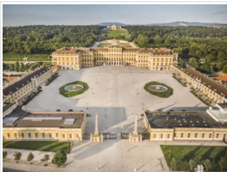
Das Schloß Schönbrunn wurde mit dem Tourismus-Exportpreis 2023 in Gold ausgezeichnet.

Mit dem österreichischen Exportpreis wurden dieser Tage nach zweijähriger, pandemiebedingter Pause wieder erfolgreiche Exportunternehmen der Tourismus- und Freizeitbranche mit Gold, Silber und Bronze ausgezeichnet. Mit dem Preis werden überdurchschnittliches Engagement und Erfolge heimischer Betriebe gewürdigt, die durch die Betreuung ausländischer Gäste wesentlich zum Dienstleistungsexport und damit zur positiven Entwicklung