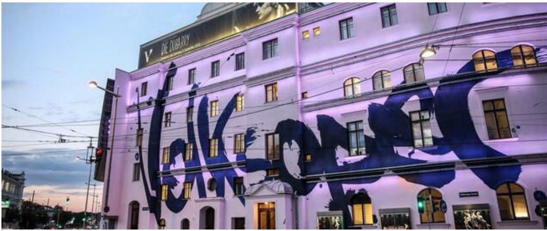
Die Volksoper Wien ist eine der Kooperationspartnerinnen.

Kooperationen mit renommierten Institutionen wie etwa der Volksoper Wien, den Wiener Sängerknaben, dem Sigmund Freud Museum oder dem Burgtheater machten das The Harmonie Hotel gerade für internationale Künstler und Künstlerinnen attraktiv. Zudem kommen auch gern Gäste herein, die diese Kulturinstitutionen in Wien besuchen möchten.